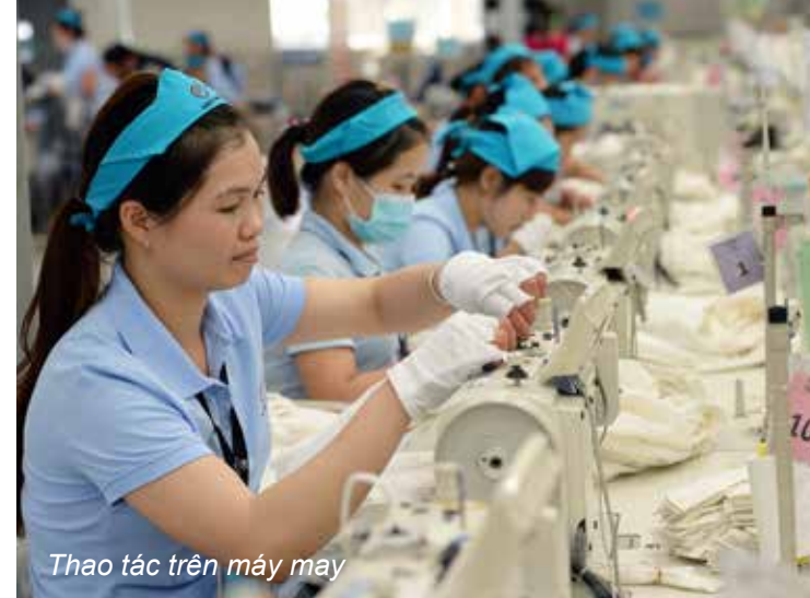
Thao tác trên máy may