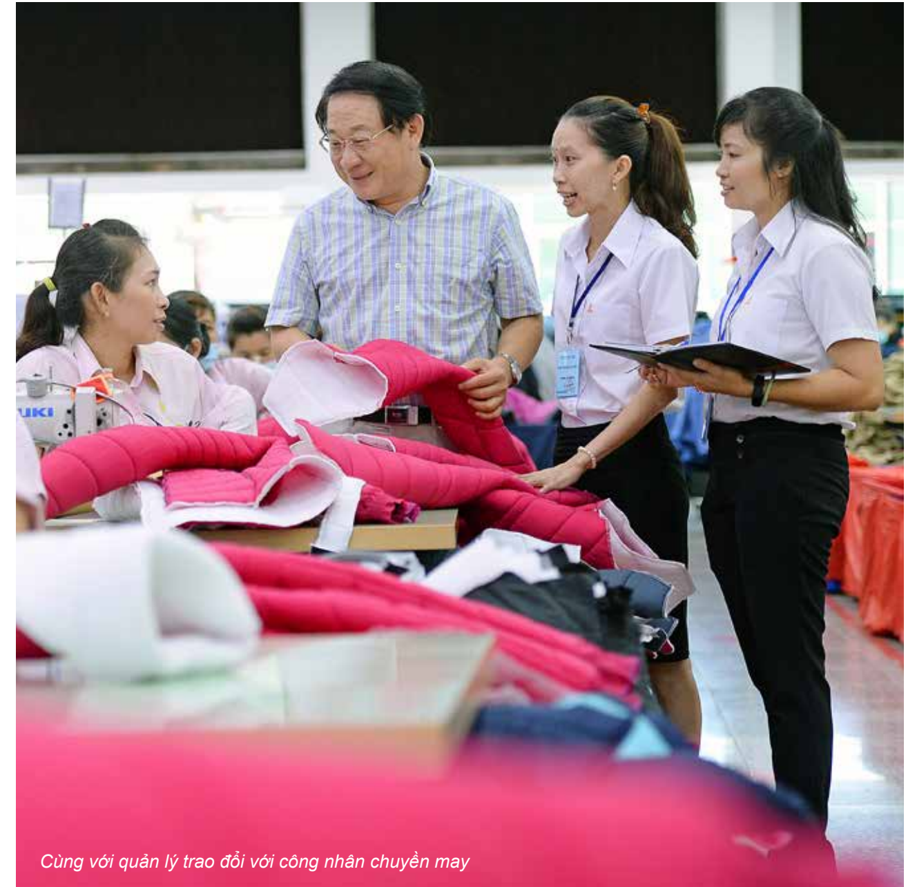
Cùng với quản lý trao đổi với công nhân chuyên may

“ Bản thân luôn mong muốn đóng góp nhiều hơn nữa cho công ty và giúp cho các anh chị em công nhân khác có cuộc sống ngày càng tốt hơn. Tôi cũng muốn học thêm các kiến thức và kỹ năng mới giúp tôi làm việc tốt hơn. ”