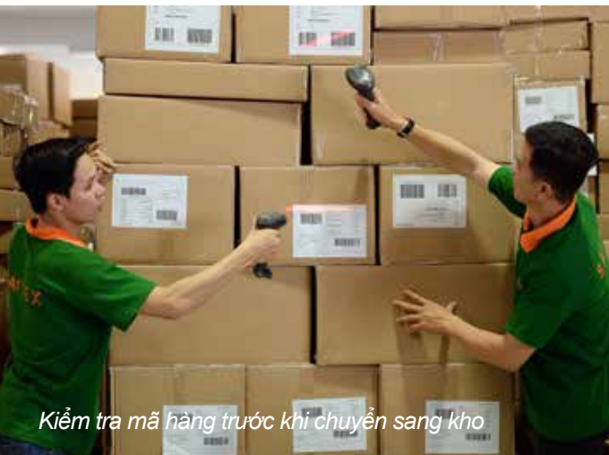
Kiểm tra mã hàng trước khi chuyển sang kho