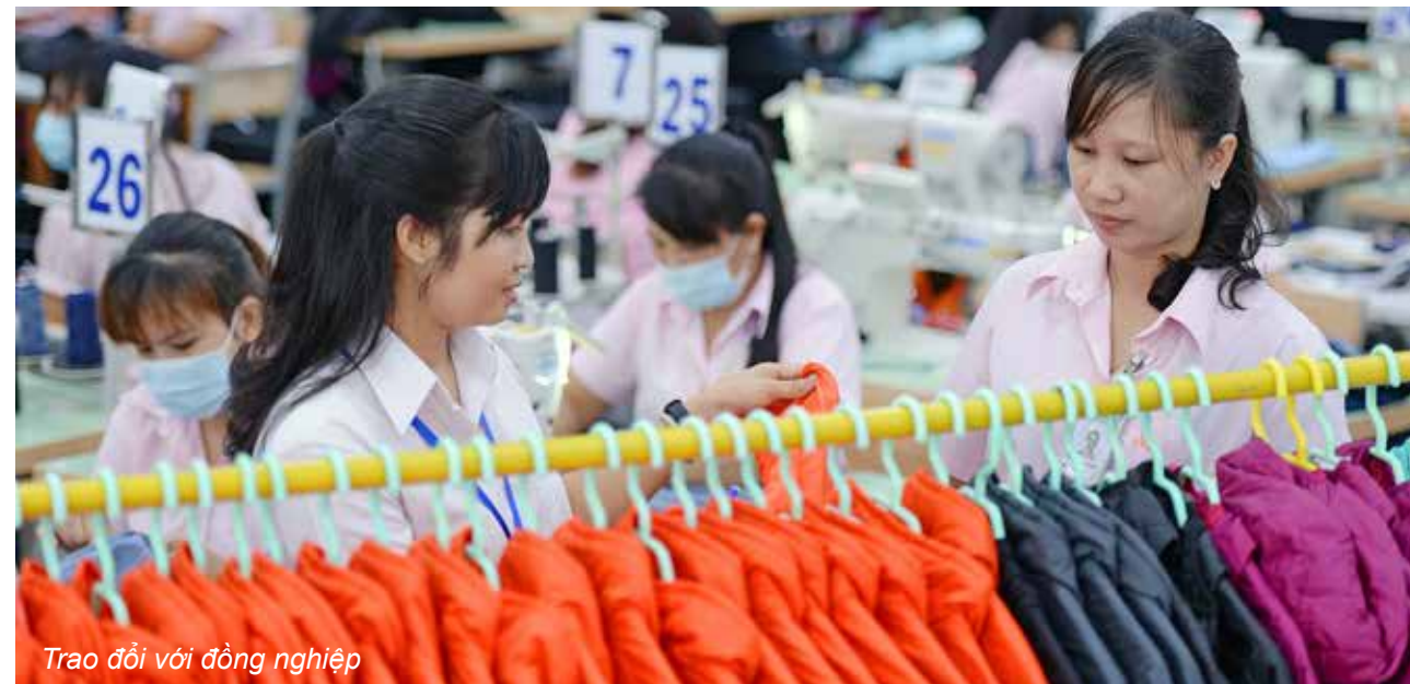
Trao đổi với đồng nghiệp