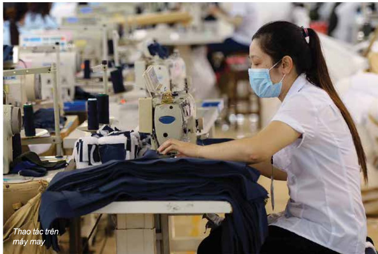
Thao tác trên máy may