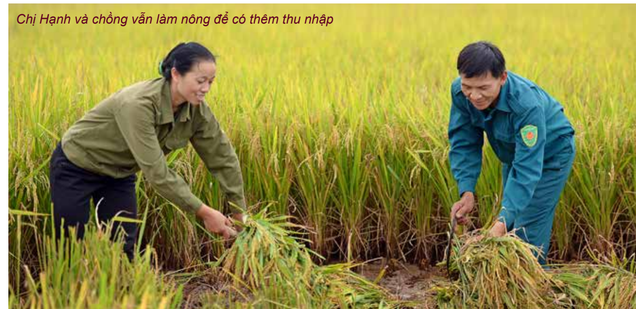
Chị Hạnh và chồng vẫn làm nông để có thêm thu nhập