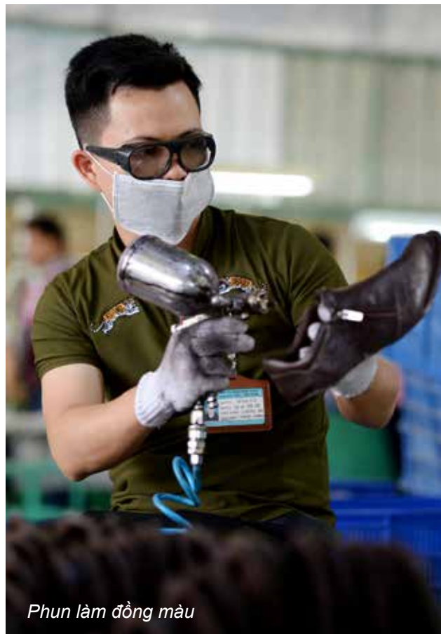
Phun làm đồng màu