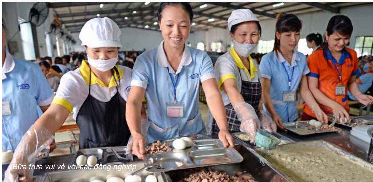
Bữa trưa vui vẻ với các đồng nghiệp