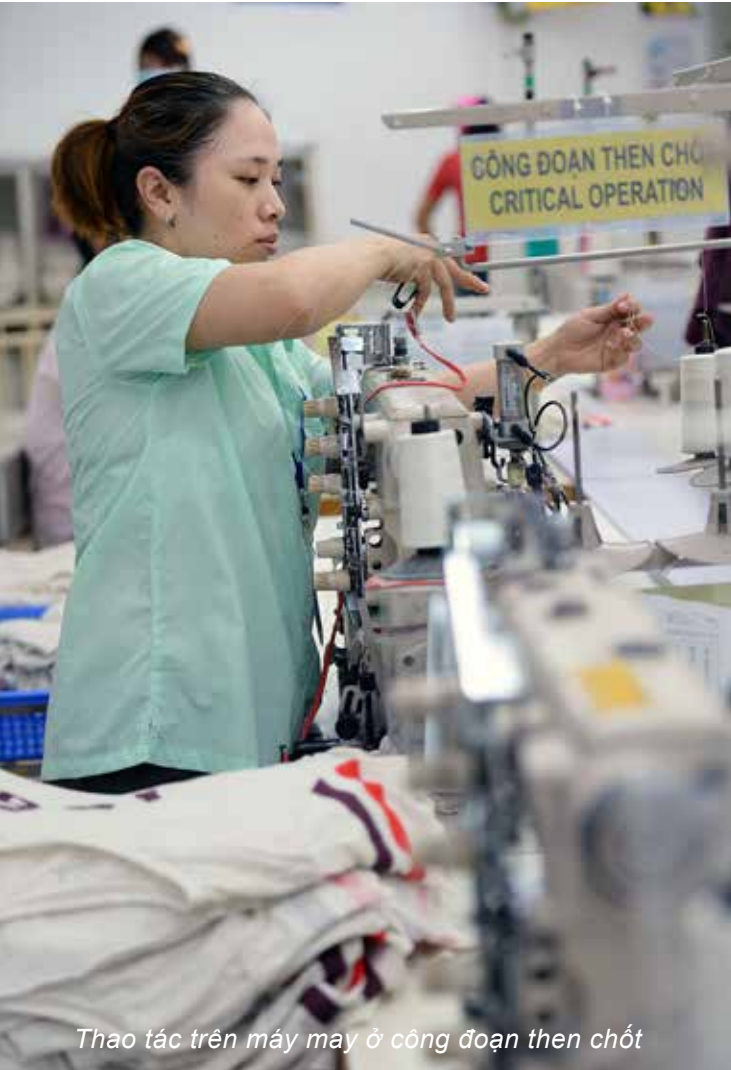
Thao tác trên máy may ở công đoạn then chốt