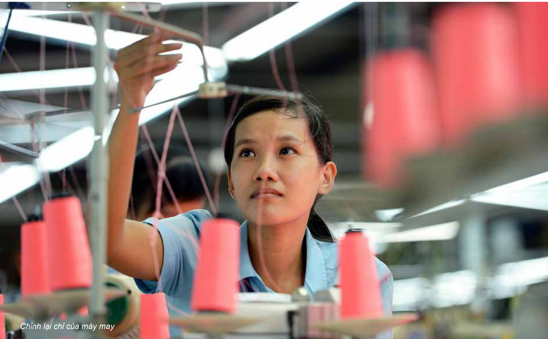
Chỉnh lại chỉ của máy may