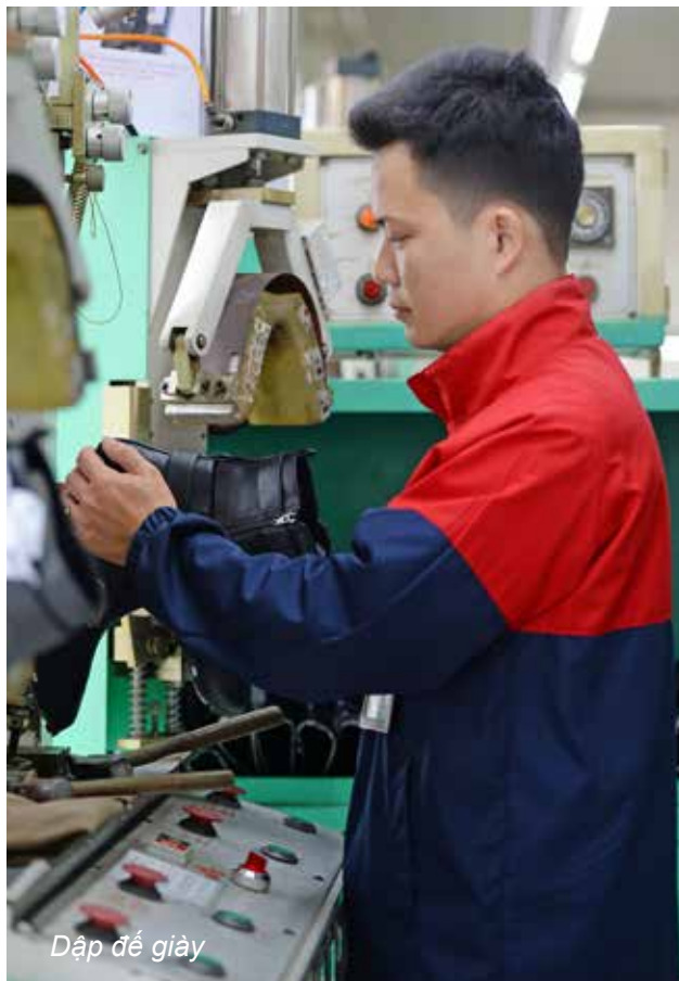
Dập đế giày