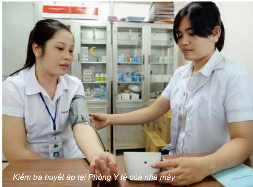
Kiểm tra huyết áp tại Phòng Y tế của nhà máy