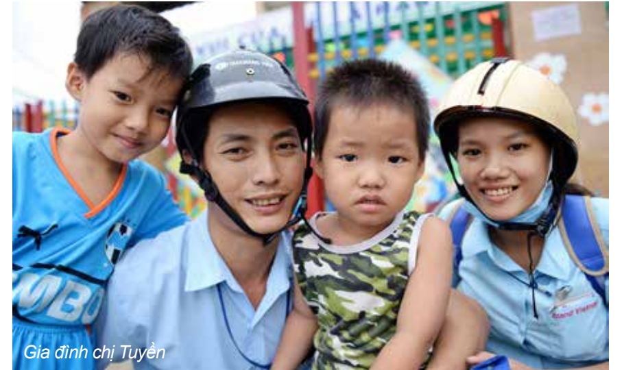
Gia đình chị Tuyên