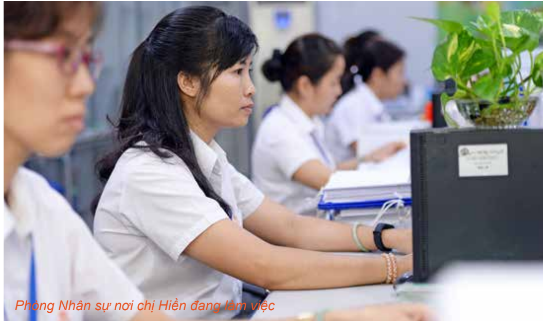
Phòng Nhân sự nơi chị Hiền đang làm việc