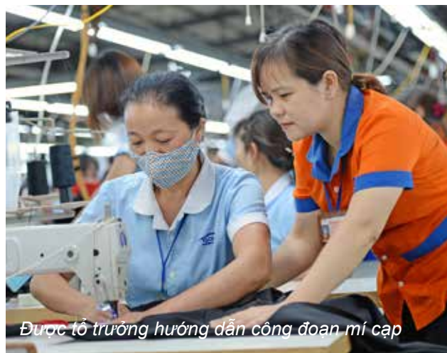
Được tổ trưởng hướng dẫn công đoạn mí cặp