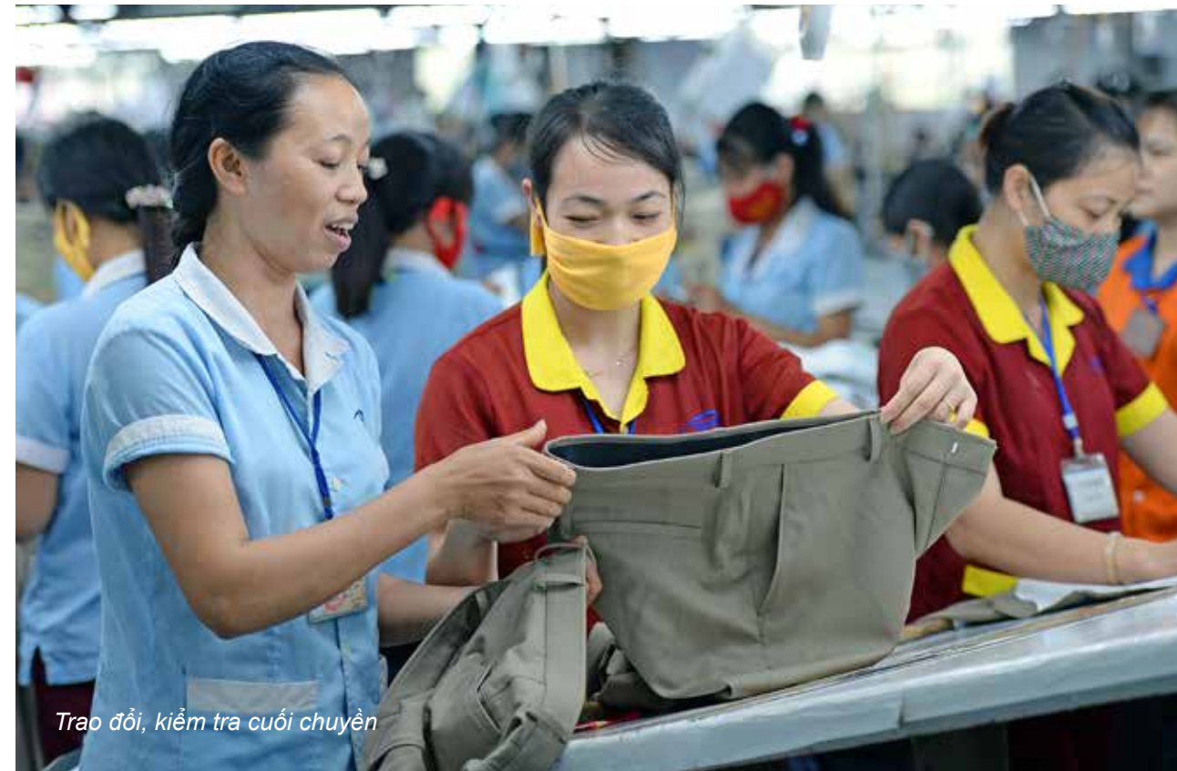
Trao đổi, kiểm tra cuối chuyền