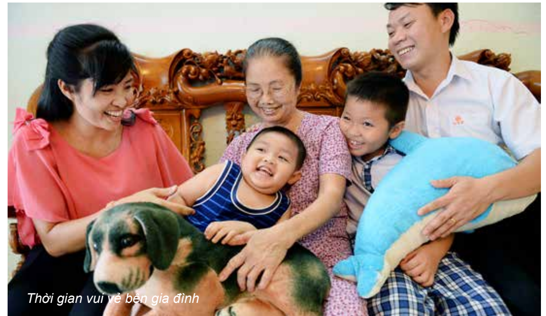
Thời gian vui vẻ bên gia đình