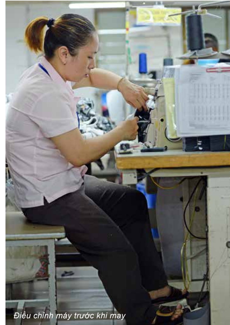
Điều chỉnh máy trước khi may