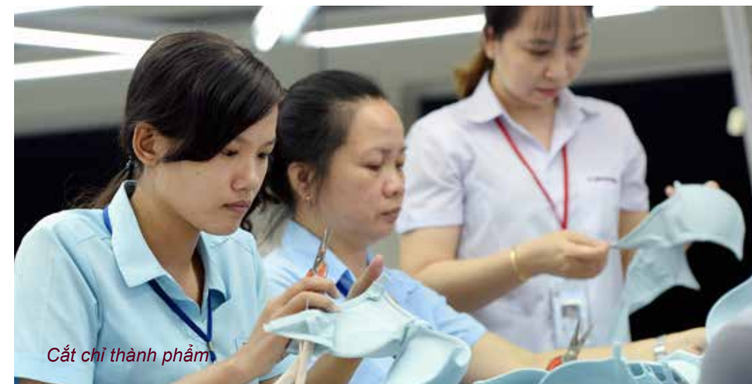
Cắt chỉ thành phẩm