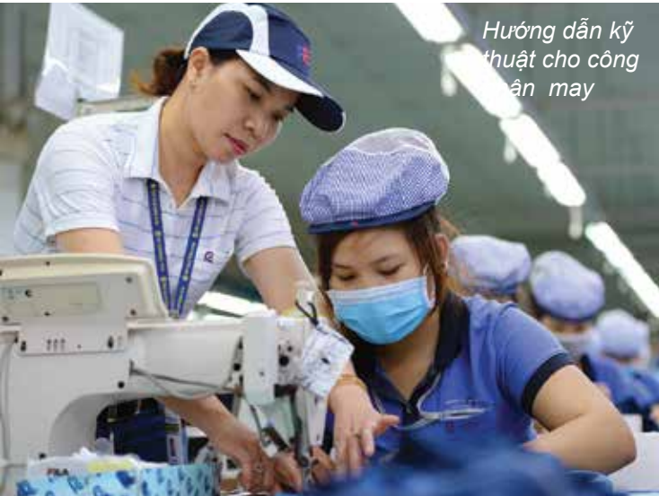
Hướng dẫn kỹ thuật cho công nhân may