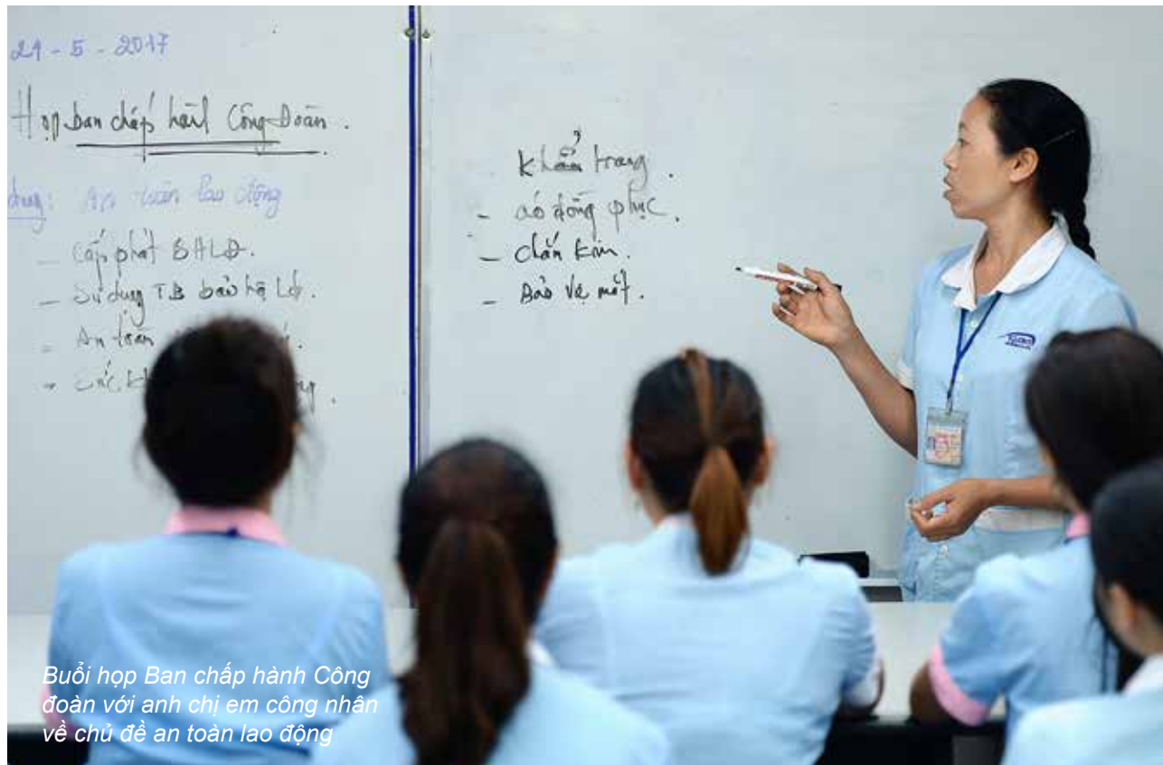
Buổi họp Ban chấp hành Công đoàn với anh chị em công nhân về chủ đề an toàn lao động