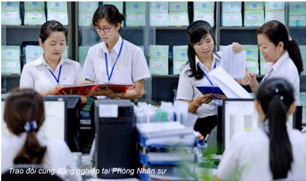
Trao đổi cùng đồng nghiệp tại Phòng Nhân sự