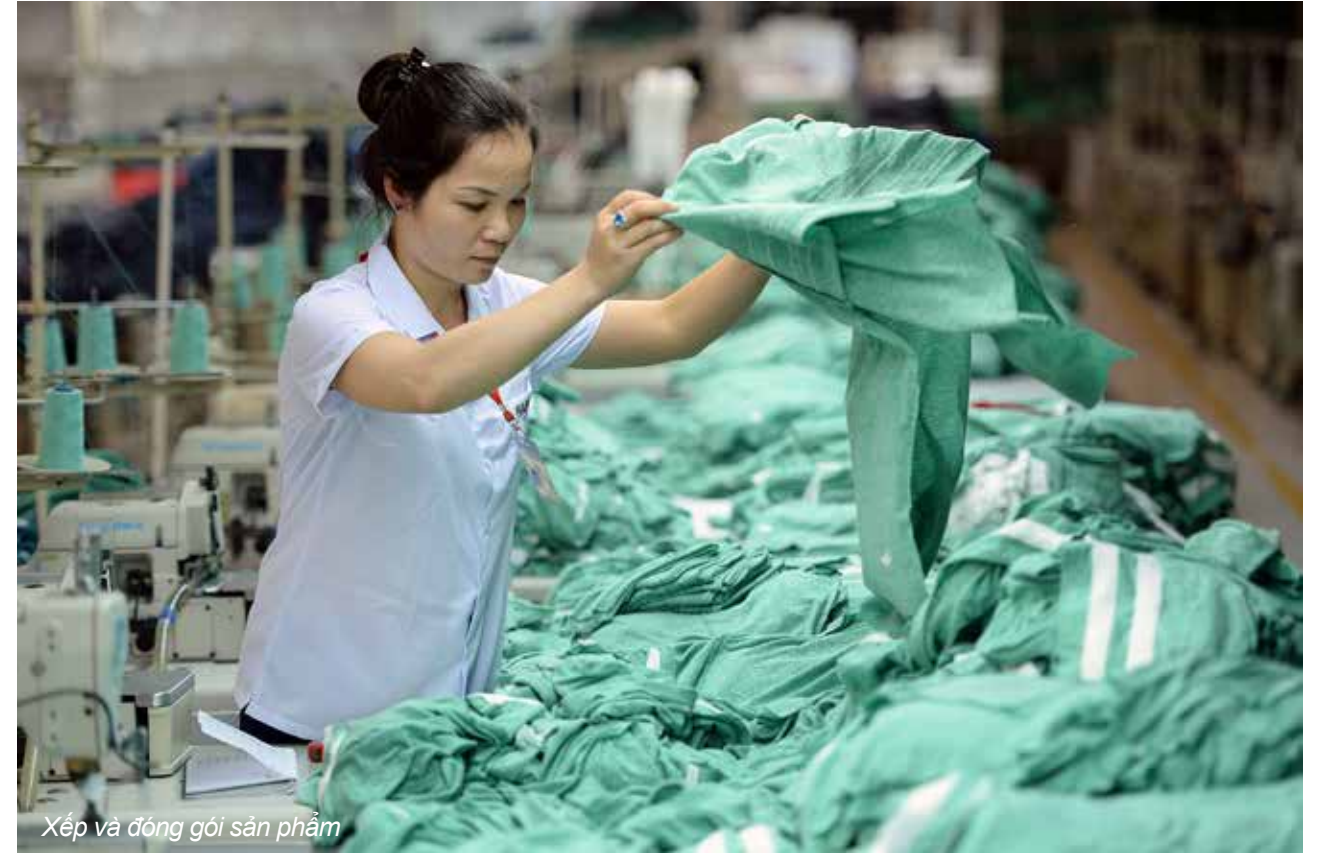
Xếp và đóng gói sản phẩm