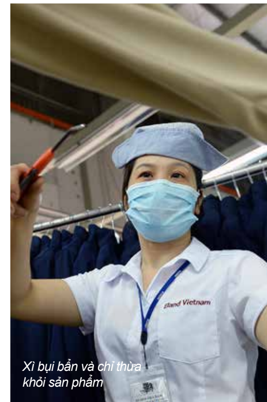
Xi bụi bắn và chỉ thừa khởi sản phẩm