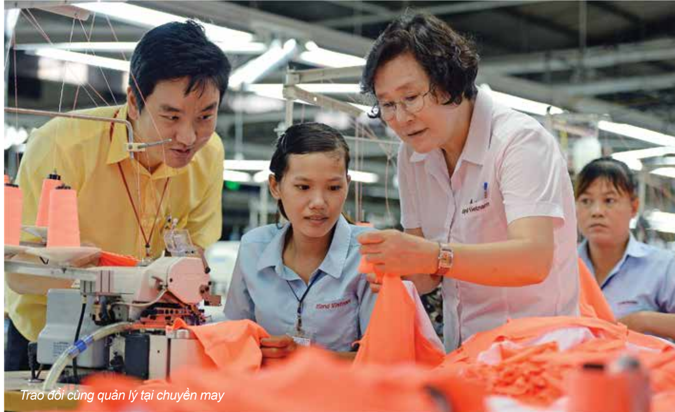
Trào đổi cùng quản lý tại chuyên may