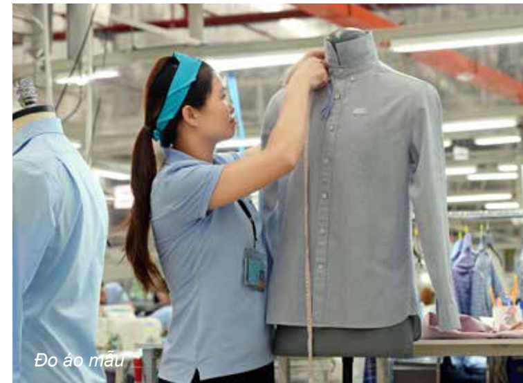
Đo áo mẫu