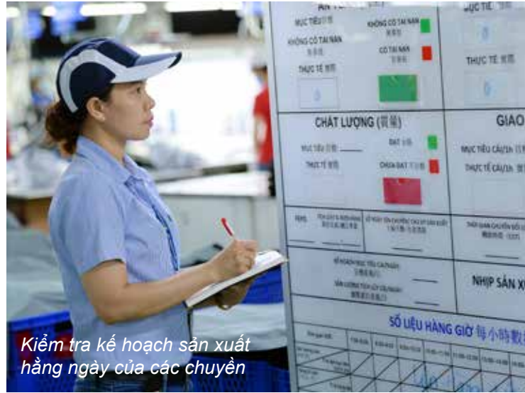
Kiểm tra kế hoạch sản xuất hằng ngày của các chuyên