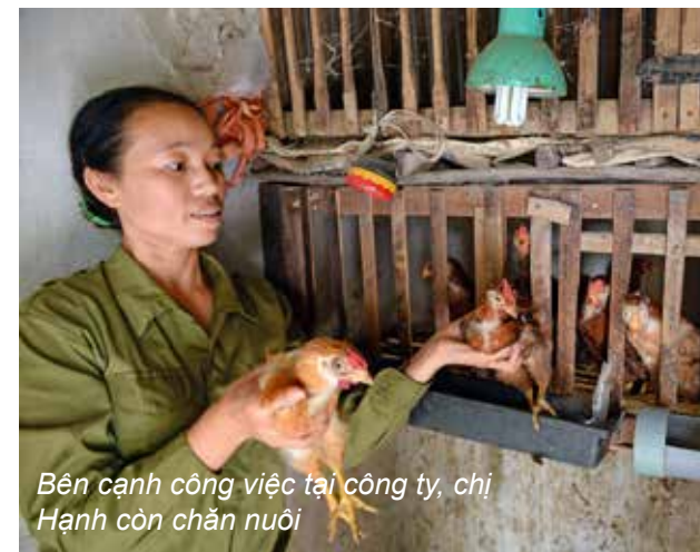
Bên cạnh công việc tại công ty, chị Hạnh còn chăn nuôi