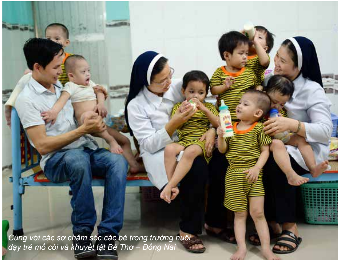
Cùng với các sơ chăm sóc các bé trong trường nuôi dạy trẻ mồ côi và khuyết tật Bé Thơ – Đồng Nai