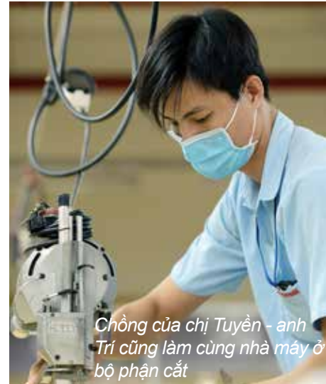
Chồng của chị Tuyên - anh Trí cũng làm cùng nhà máy ở bộ phận cắt