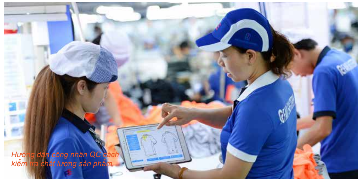
Hướng dẫn công nhân QC cách kiểm tra chất lượng sản phẩm