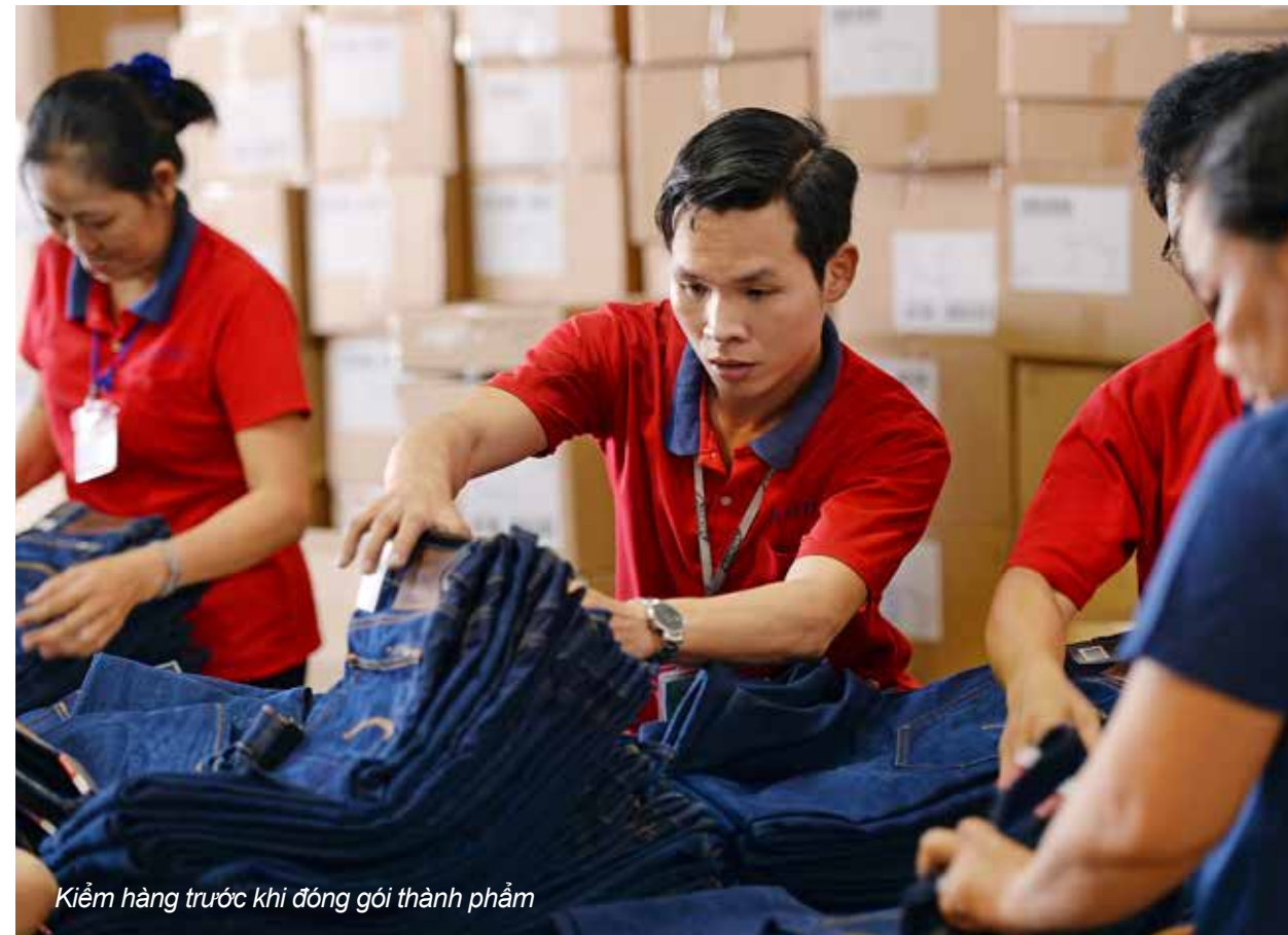
Kiểm hàng trước khi đóng gói thành phẩm