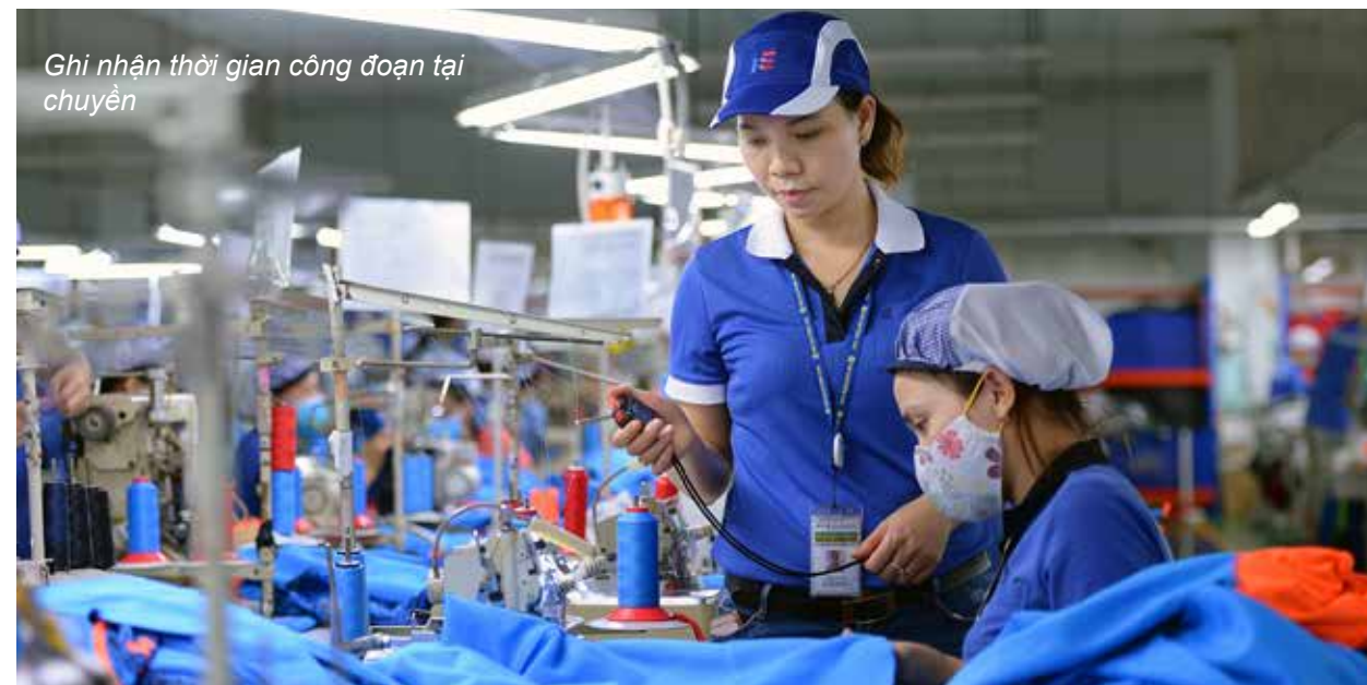
Ghi nhận thời gian công đoạn tại chuyền