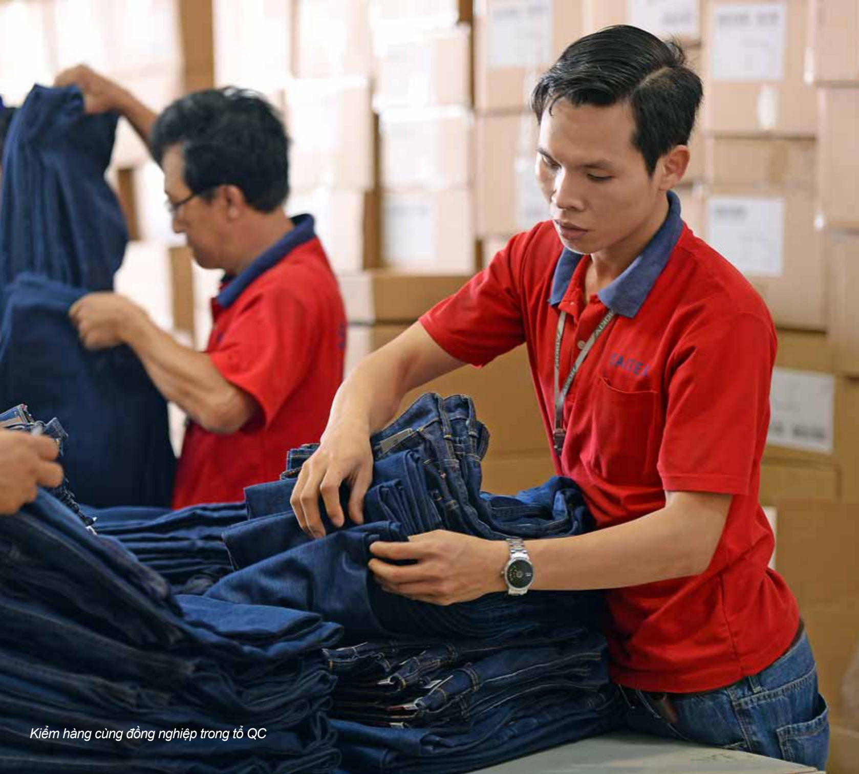
Kiểm hàng cùng đồng nghiệp trong tổ QC