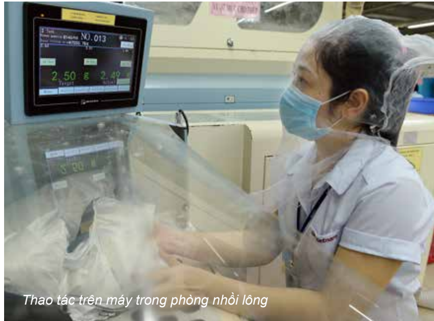
Thao tác trên máy trong phòng nhồi lông