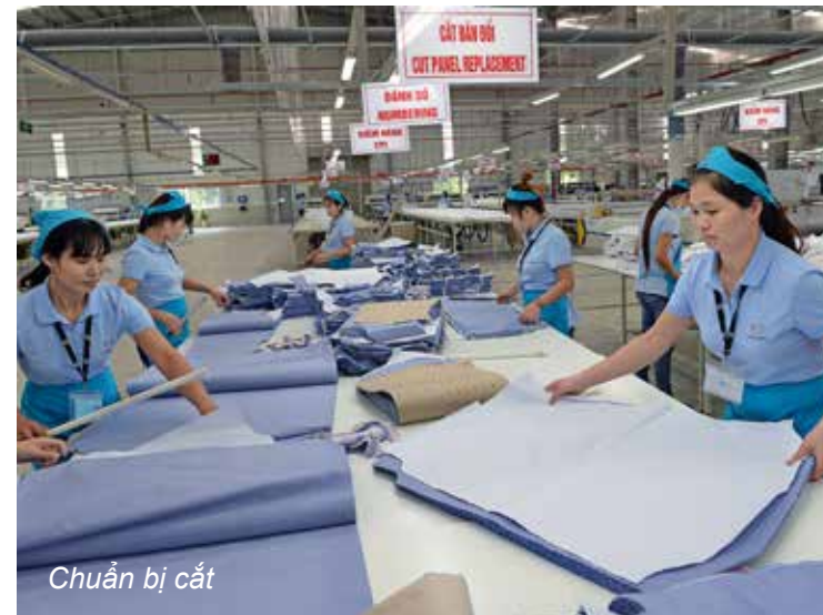
Chuẩn bị cắt