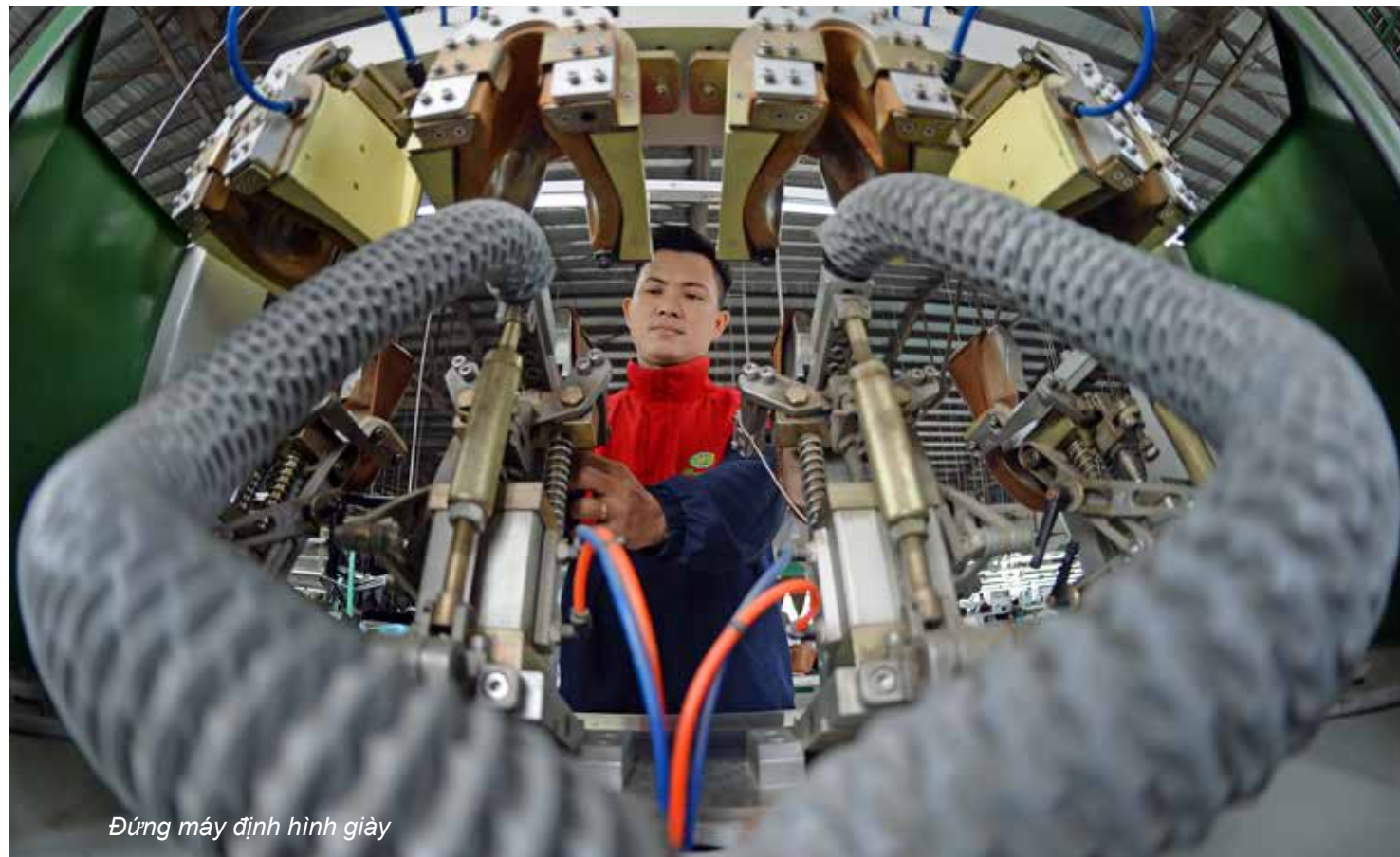
Đứng máy định hình giày