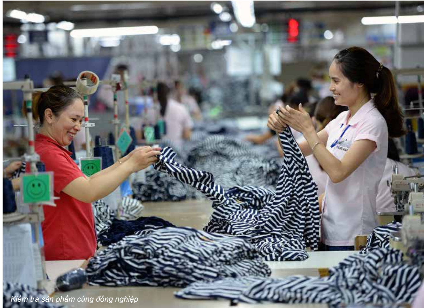
Kiểm tra sản phẩm cùng đồng nghiệp