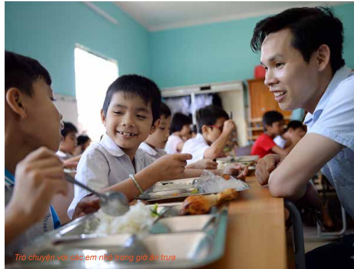
Trò chuyện với các em nhỏ trong giờ ăn trưa