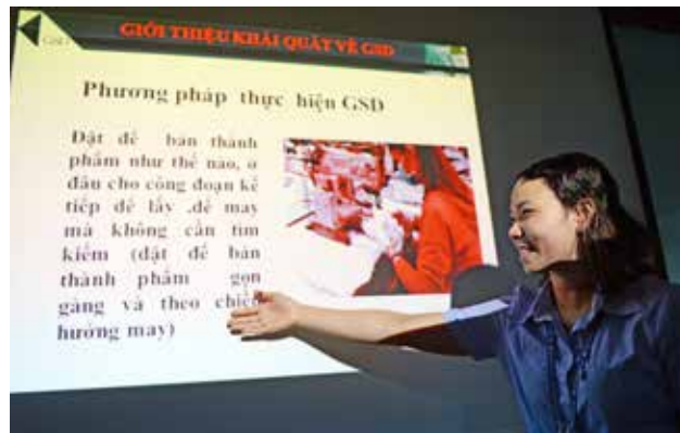
Huấn luyện cho tổ trưởng chuyền may về phương pháp thực hiện GSD

“ Luôn nỗ lực phấn đấu để được công nhận, đánh giá cao và phát triển không ngừng trong công việc. ”