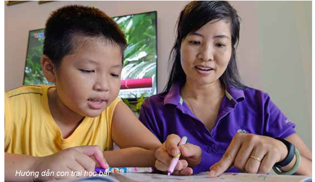
Hướng dẫn con trai học bài