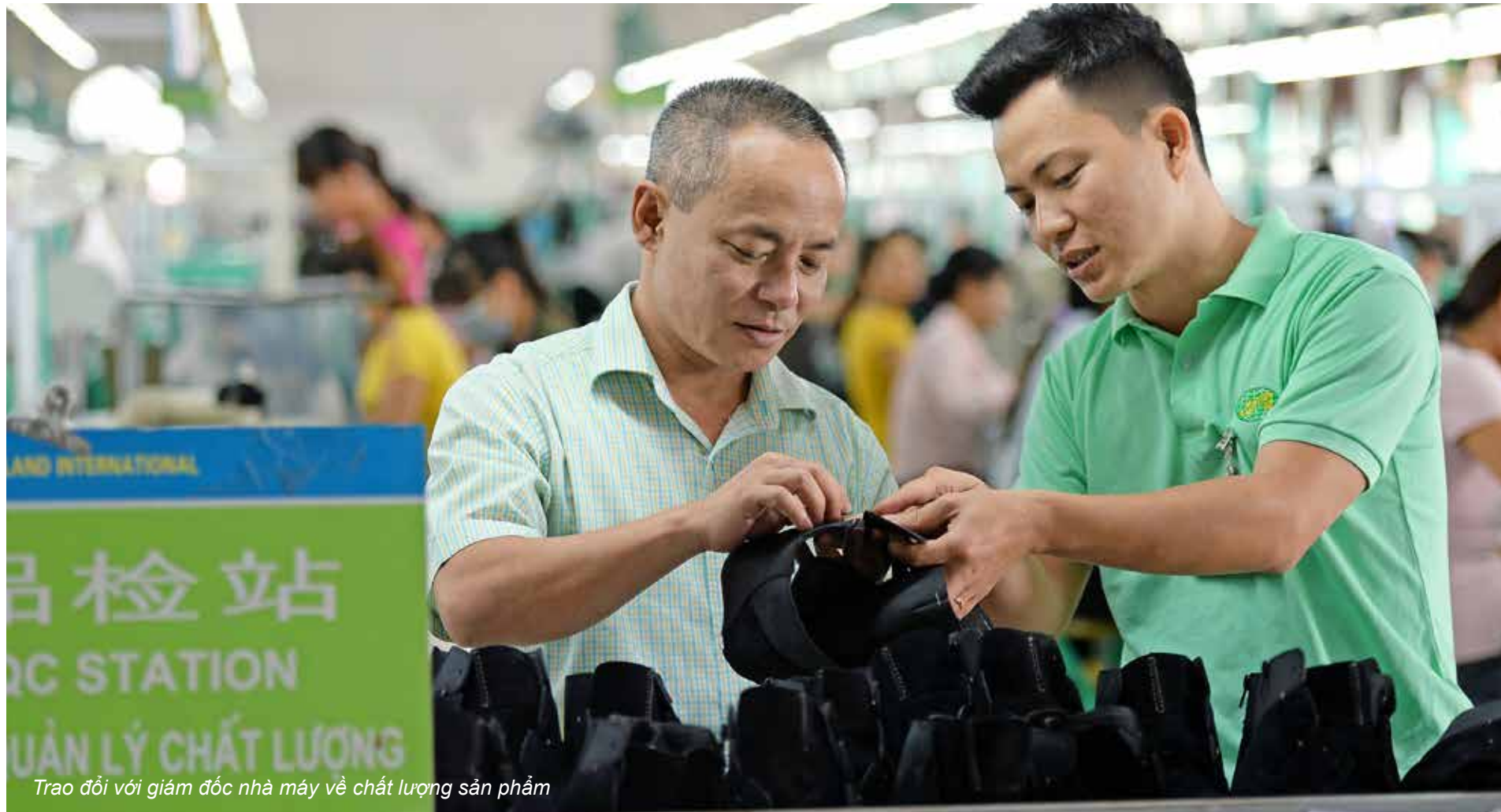
Trao đổi với giám đốc nhà máy về chất lượng sản phẩm