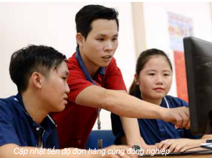
Cập nhật tiến độ đơn hàng cùng đồng nghiệp