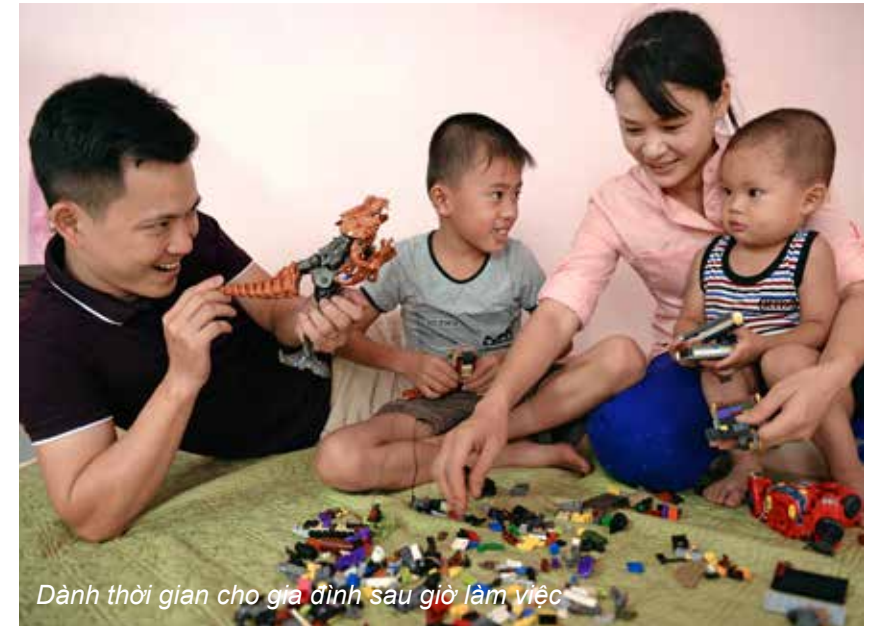
Dành thời gian cho gia đình sau giờ làm việc